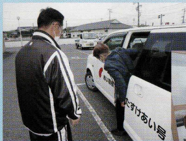
大野地区 移送サービス

“あいまむ”は、平生町社会福祉協議会の拠点の名称です。年齢や障がいに関係なく、様々な活動を通じて「自分の存在」を主張（私は…です「I am…」）できる場所、地域の皆さまお一人おひとりが様々な出逢いを通じて、“愛を編む”場所を目指します。