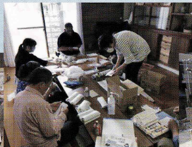
佐賀地区 ふれあい訪問