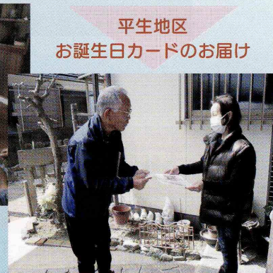
平生地区 お誕生日カードのお届け