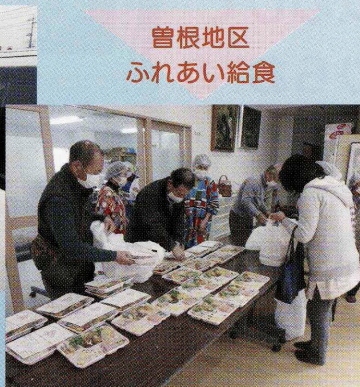
曾根地区 ふれあい給食