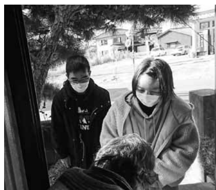
年越しそば配食事業の様子

きょうりょく ぼ きん いち ぶ さいまつ みまい ご協力いただきました募金の一部は、歳末たすけあい見舞 金事業として、町内在住のご自宅で過ごされている要介護5 の方や、ご自宅で長期にわたり療養されている方等にお届け しました。また、年越しそば配食事業にも活用させていただきました。