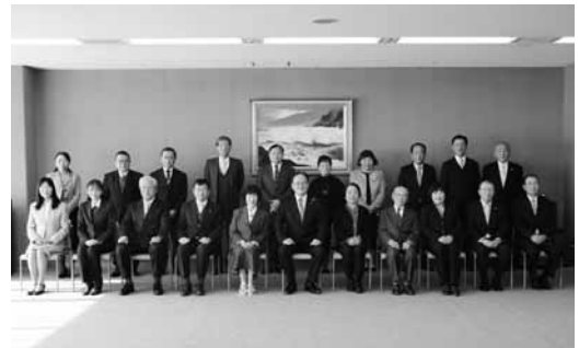
12月24日に山口県庁で行われた伝達式の様子