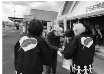
ひらお特産品センター

寄せいただきました。お寄せいただいた募金は、全額を山口県共同募金会に送金し、12月31日実施の「年越しそば配食事業」等、歳末たすけあい事業の貴重な財源として活用させていただきました。皆さまの温かいお気持ち、ありがとうございました。