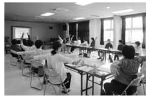
フレイル予防の体操を実践されました！