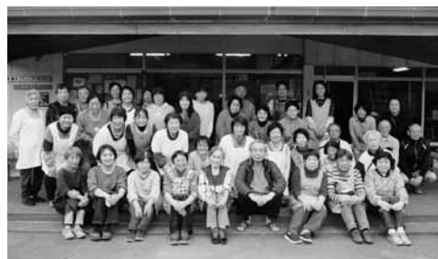
みやま会、ふれあい推進員など47名が参加