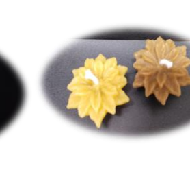
フロート花 2 色 500 円 (箱入り 1 ケ プレミア色) 高さ 1.5 cm 最大横長さ 5 cm