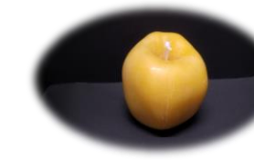
りんご 1700 円 燃焼時間 約 5 時間 高さ 6cm 最大直径 7cm