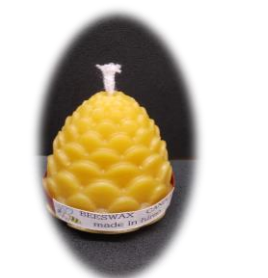
松ぼっくり 1273 円 燃焼時間 約 5 時間 高さ 6.5cm 底面直径 5.5cm