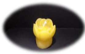
立花 250 円 燃焼時間 約 1 時間 高さ 3cm 底面直径 3.2cm