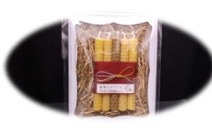
ろうそく 5 本箱入り 1000 円 (1 本プレミア色入り)