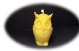
みみずく 400 円 燃焼時間 約 1.5 時間 高さ 4cm 底面 3cm