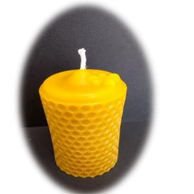
蜂ろうそく大 3000 円 燃焼時間 約 8 時間 上部に蜂さん有 高さ 10 cm 底面直径 5.5 cm