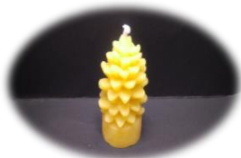
もみのき 400 円 燃焼時間 約 2 時間 高さ 6.5cm 底面直径 3cm