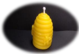
蜂さん 450円 燃烧時間 約 2 時間 高さ4.5cm 底面直径4cm