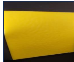
みつろう板(A4 サイズ) 12 円/1g レターパック送料 370 円で送れます。 1 枚 600g前後