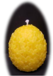
花キャンドル大 4,500 円 燃烧時間 約 48 時間以上 高さ 10cm 最大直径 7cm