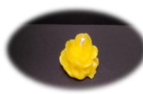
バラ極小 100 円 燃烧時間 約 1 時間 高さ1.5cm 底面直径3.3cm