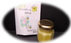
みつろうクリーム手作りキット 150 円 瓶は付いていません(作成見本です) 作り方の紙が入っています。