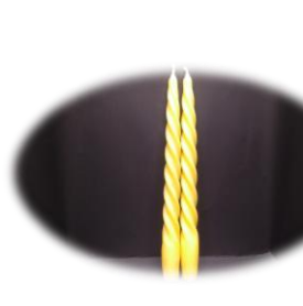
ろうそく大 2 本 1100 円 燃焼時間 約 5 時間(1 本) 長さ 19cm 底面直径 1.7 cm