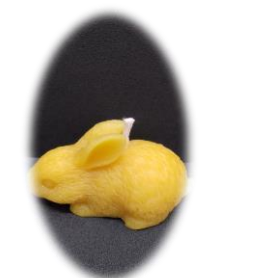
うさぎ 827 円 燃焼時間 約 1.5 時間 高さ 4.5cm 全長 8cm