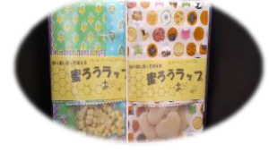
みつろうラップ手作りキット 600 円 布 35×30 cm、みつろう入り 作り方の紙が入っています。