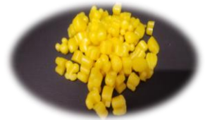
チップみつろう 加工しやすいです 1 粒 1~2g前後 15円/1g