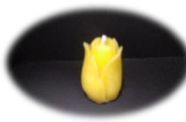
チューリップ 350 円 燃焼時間 約 1.5 時間 高さ 3.5cm 底面直径 3cm