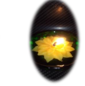
フロート黄色 200 円 燃焼時間 約 1 時間 (水に浮かびます)