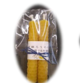
ろうそく 2 本 300 円 燃焼時間 約 1 時間(1 本) 長さ 10cm 直径 1.2cm