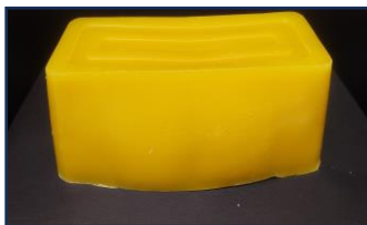
ミツロウブロック 約 16 cm×6 cm×5.5 cm 12 円/1g 大量購入におすすめ 1 ブロック 570g前後

上記商品の詰め合わせギフト包装いたします。 (箱・ラッピング代・送料が別途必要になります)