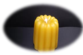
カヌレ 1,000 円 燃烧時間 約 13 時間 高さ4.5cm 底面直径5cm