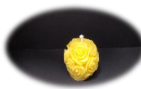
バラボール 550 円 燃焼時間 約 2 時間 高さ 4.5cm 底面直径 4cm