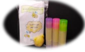
みつろうリップ手作りキット 250 円 容器 3 本付(作成見本です) 作り方の紙が入っています。