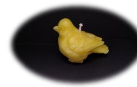
鳥 591 円 燃焼時間 約 1 時間 高さ 4.5cm 全長 8cm