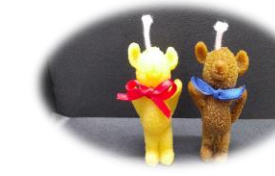
くまペア 500 円 燃焼時間 約 30 分(1 体) 高さ 6.5 cm