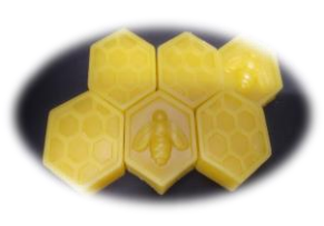
蜂の巣固形 高さ1.3cm 対角長さ 4 cm 1 個 14g前後 13 円/1g