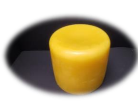
丸ブロック 高さ 5 cm 底面直径8.5cm 12 円/1g 1 ブロック 300g前後