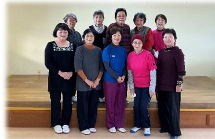
ささゆり会（太極拳）