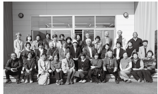
最後に参加者の皆さんで 集合写真を撮りました

平生中学校の皆さんが、大野地区社会福祉協議会の皆さんが実施するふれあい給食（月1回手作りのお弁当を高齢者へお届け）への協力として、お弁当につける掛け紙の作成に取り組まれています。子どもたちからのイラストやメッセージはお弁当を受け取られる多くの方に大変喜ばれています。生徒会の皆さんを中心にお昼休みの時間に活動されており、取材させていただいた日は、校内放送でボランティア活動があることを呼びかけられ、約20名の生徒の皆さんが集まっておられました。和気あいあいとした雰囲気、で、「誘われて参加したけど、やってみると楽しい」といった感想があり、みんなで楽しく作業したことが誰かの喜びにつながっていることに、やりがいを感じておられました。